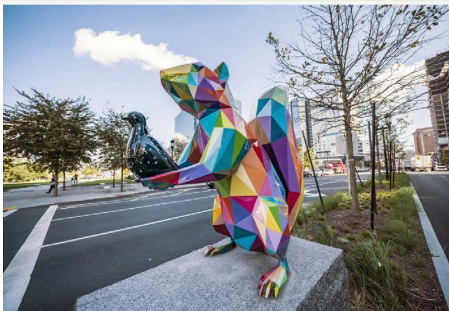
Рис. 3 Air Sea Land. Okuda San Miguel.