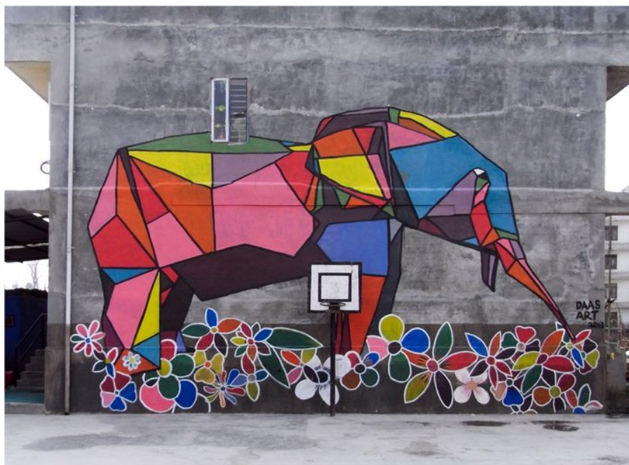
Рис. 4 Elephant in a field of flowers, DAAS.

Арт-объекты могут быть классифицированы по типу, виду, качеству, категории материалов, используемых для изготовления инсталляции. Например, камень, металл, дерево, стекло, керамика, текстиль, пластик и т. д. Все материалы можно разделить на три категории: стандартные, необычные, искусственные материалы и новые технологии. Каждый материал имеет свои уникальные свойства и может быть использован для создания различных эффектов в искусстве. Например, камень может быть использован для создания прочных и долговечных скульптур, в то время как стекло может быть