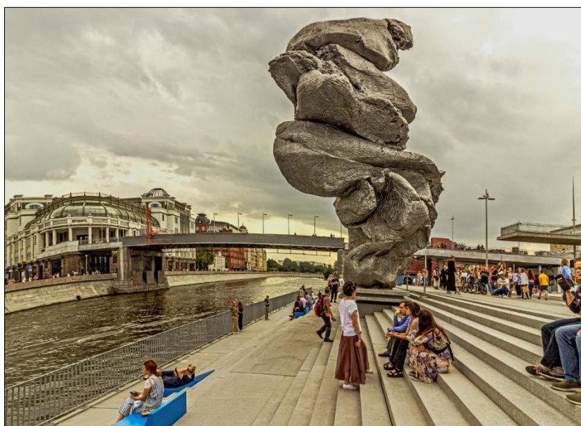
Рис. 1 Большая глина №4, Урс Фишер

Арт-объекты в современном городском пространстве весьма разнообразны, но имеют некоторые общие особенности, отражающиеся в концепции образного решения. Возможно классифицировать арт-объекты по следующим критериям: цель создания, расположение, функция, форма, материалы и т.д. [4].