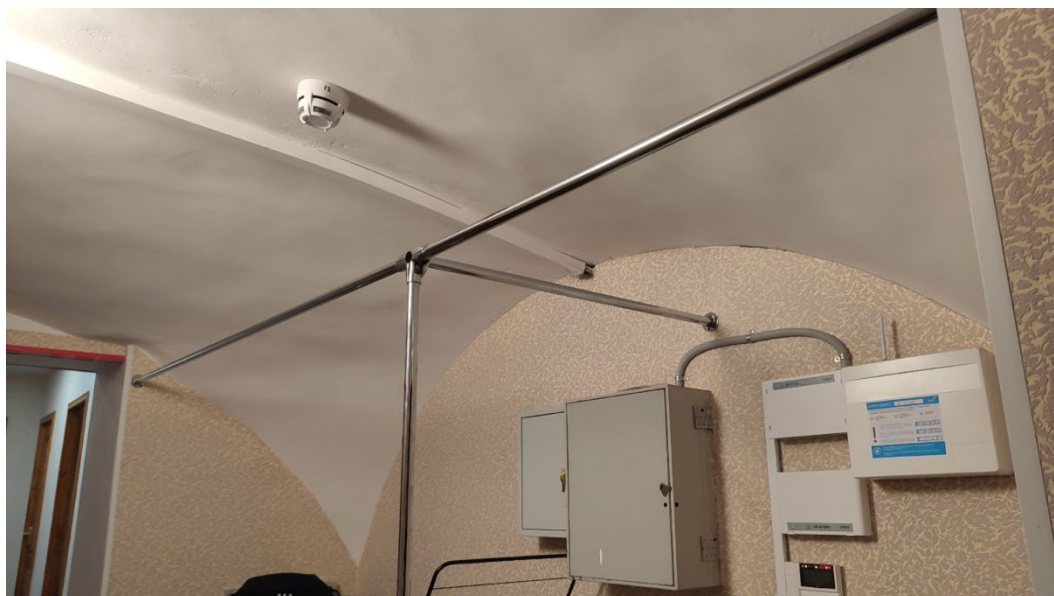
Рис. 5. Фрагмент интерьера первого этаж

Внешняя архитектурно-пространственная композиция объекта имеет утилитарный характер. Убранство фасадов со временем претерпело изменения: утрачены аттики и балкон на южном фасаде. Сохранились наличники и пилястры, контур по несущим стенам здания, в интерьере – исторический вспарушенный свод на первом этаже, который относится к наиболее ранней части флигеля, построенной до 1877 г. (рис. 5-8).