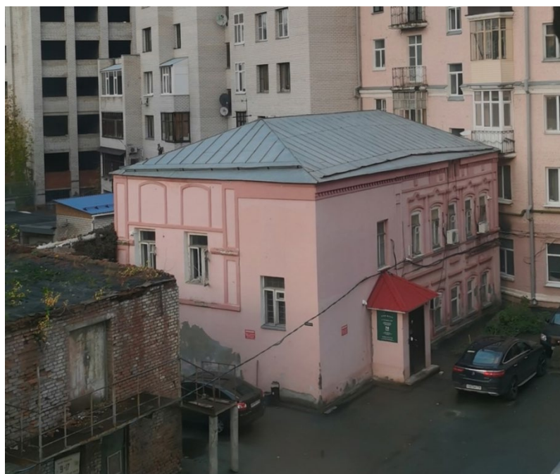
Рис. 4. Современный вид флигеля домовладения Апехтиной-Афанасьева, расположенного по адресу г. Казань, ул. Бутлерова, 45/8

В советский период строение в плане приобрело прямоугольный вид и лестницу на второй этаж в юго-западном углу постройки. Функция на данный период не известна. Позднее к южному фасаду был пристроен тамбур (рис.4). Сейчас здание занимает hostel «For Rest».