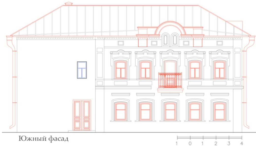
Рис. 7. Картограмма утрат южного фасада