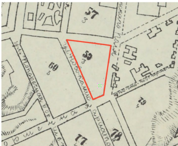
Рис. 1. План города Казани 1899 г.

строение не является архитектурной доминантой квартала. Объемно-пространственная организация застройки участка относится к традиционной для своей эпохи, когда главный дом выходил на красную линию улицы, а служебные строения располагались в дворовой части по периметру территории.