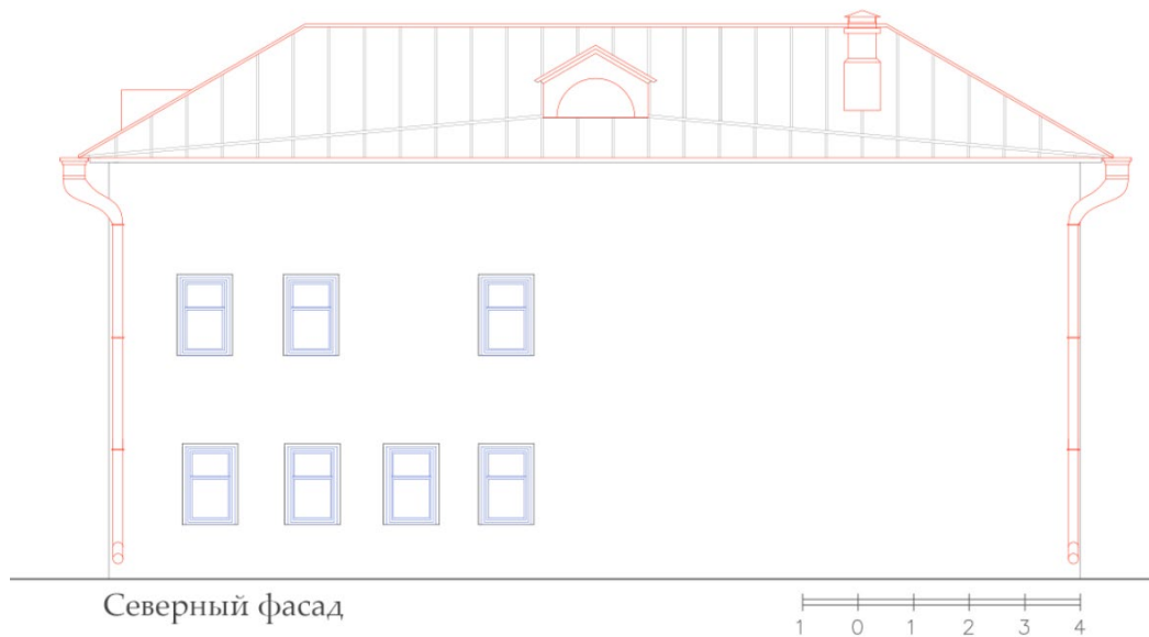
Рис. 8. Картограмма утрат северного фасада