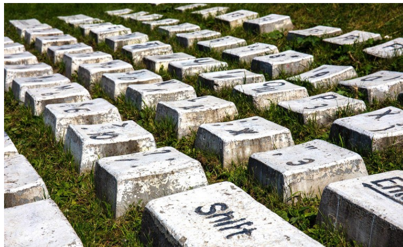
Рис. 4. Памятник клавиатуре

Интегрированные арт-методы – произведения искусства, встроенные в ткань здания или такие места, как художественно оформленный фасад, ландшафтный дизайн или специально изготовленная фурнитура для пола или потолка. Этот вид арт-метода обычно предполагает совместную работу художника, архитекторов, дизайнеров интерьеров и строителей новых или реконструируемых объектов истории (рис. 4).