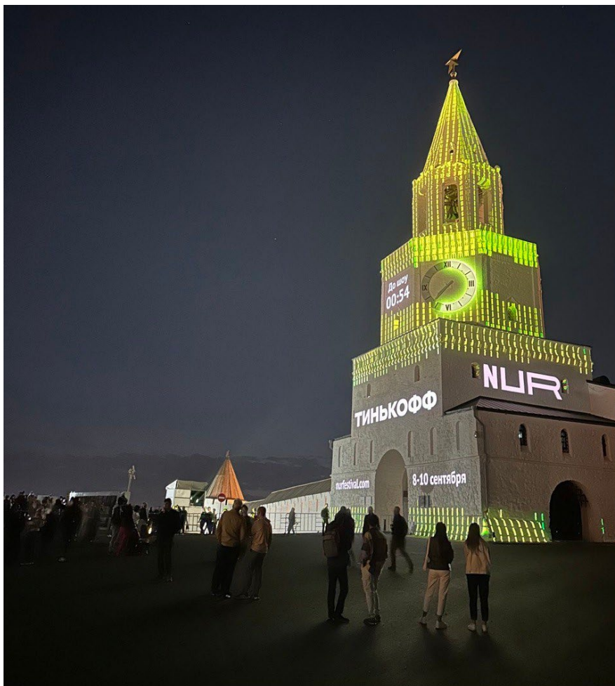
Рис. 6. Международный фестиваль «НУР» в Казани, 2023 г.

Медиа-арт имеет огромный потенциал для улучшения общественного пространства и создания уникальных и запоминающихся произведений искусства (рис. 6). Отличается игрой света и звуковым сопровождением.