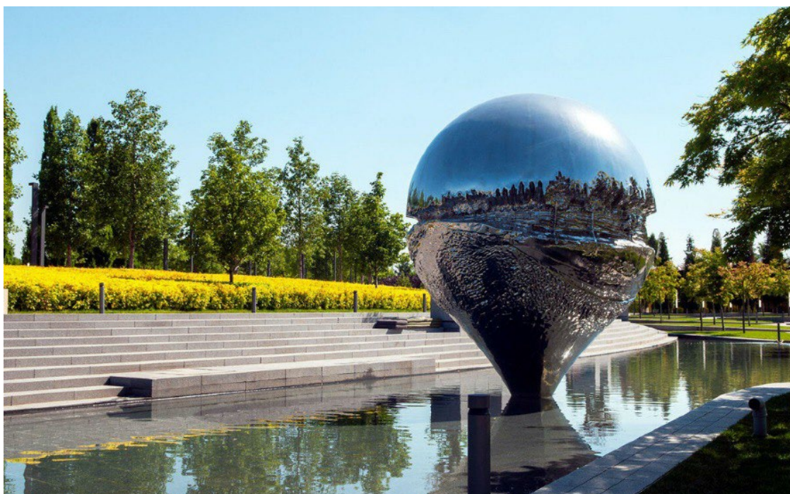
Рис. 2. Геолокация. Парк г. Краснодар

Постоянный арт-метод – произведение искусства, эксплуатация которого рассчитана на длительный период времени – как правило, двадцать лет и более. Постоянные общественные произведения искусства часто изготавливаются из камня или бронзы, поэтому их расположение и установка являются важными факторами. Мемориалы и памятные произведения искусства – частые примеры постоянных публичных произведений искусства (рис. 2).