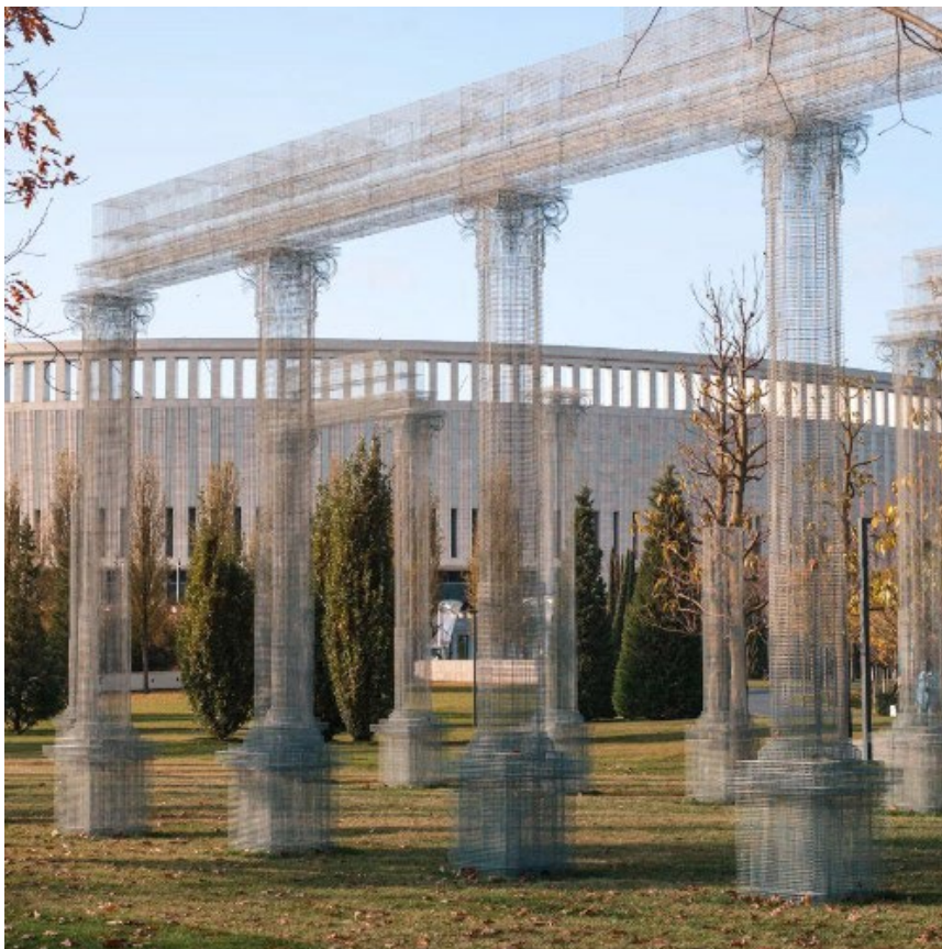
Рис. 7. Арт-объект, световая инсталляция «Абстракта» в парке г. Краснодар