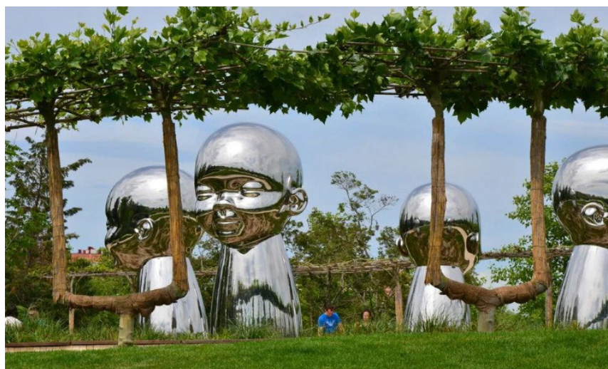
Рис. 9. Экологические МАФы в парке г. Краснодар

Дизайн городской среды – особая форма художественного синтеза предметно-пространственных форм в городском пространстве (рис. 9). Технологическое решение и художественный образ дизайн-объектов зачастую несут экологическую функцию в том числе [10].