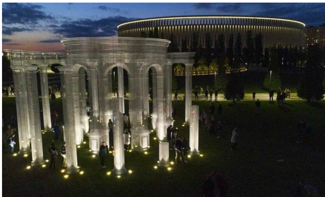
Рис. 8. Арт-объект, световая инсталляция «Абстракта» в парке г. Краснодар