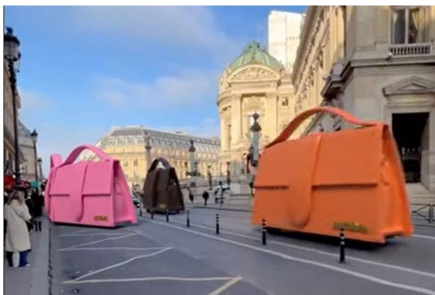
Рис. 10. Гигантские сумки Jacquemus разъезжают по Парижу. В 3D-рекламе брендовые аксессуары стали автобусами

Реклама демонстрирует товары и услуги, информирует потребителей, призывает к действиям, личному участию в решении проблем (рис. 10).