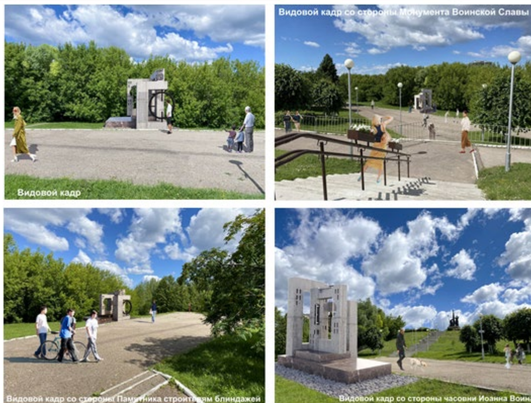
Рис.5. Концепция мемориала памяти погибших в ходе СВО и благоустройство территории мемориального парка «Победа» в городе Чебоксары

Памятник будет целостным и единым на территории парка, находится в подчинении главной доминанты и сомасштабен другим объектам исторических событий. Основные материалы Мемориала – это гранитная плита размером 2,4x4,1 м и бетонные буквы с армированием. Общая высота мемориала составляет три метра, что является отличной точкой восприятия и визуализации для каждого человека (рис. 6).