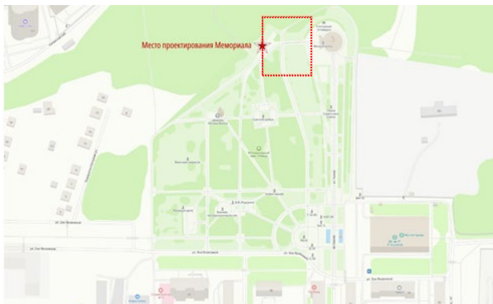
Рис.1. Ситуационный план

Мемориальный парк «Победа» расположен на берегу Волги в городе Чебоксары на ул. Зои Яковлевой (рис. 1).