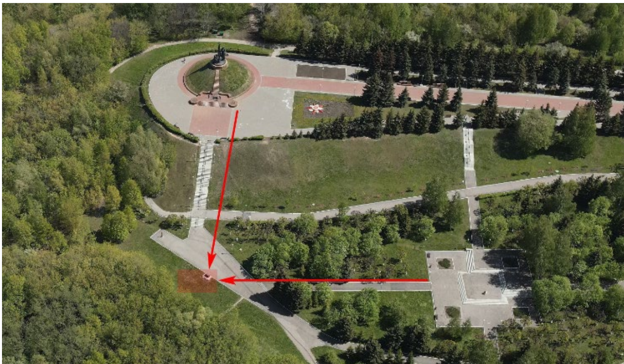
Рис.3. Фотофиксация территории установки мемориала. Цветом и стрелками показано место закладки камня будущего памятника.

Территория проектирования Мемориала памяти погибших в ходе СВО находится в зоне охраны ландшафта объекта культурного наследия (ОКН) регионального значения «Монумент в честь воинов-чебоксарцев, погибших в Великой Отечественной войне 1941-1945 гг.» и расположена в левой части парка от главной доминанты города – монумента воинской славы (рис. 3).