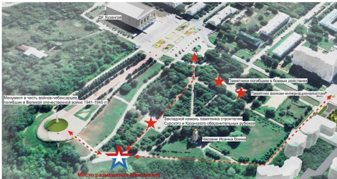
Рис.2. Место проектирования Мемориала

Ключевой объект парка, в охранной зоне которого находится территория проектирования Мемориала, – «Монумент в честь воинов-чебоксарцев, погибших в Великой Отечественной войне 1941-1945 гг.», являющийся объектом культурного наследия регионального значения (рис. 2).