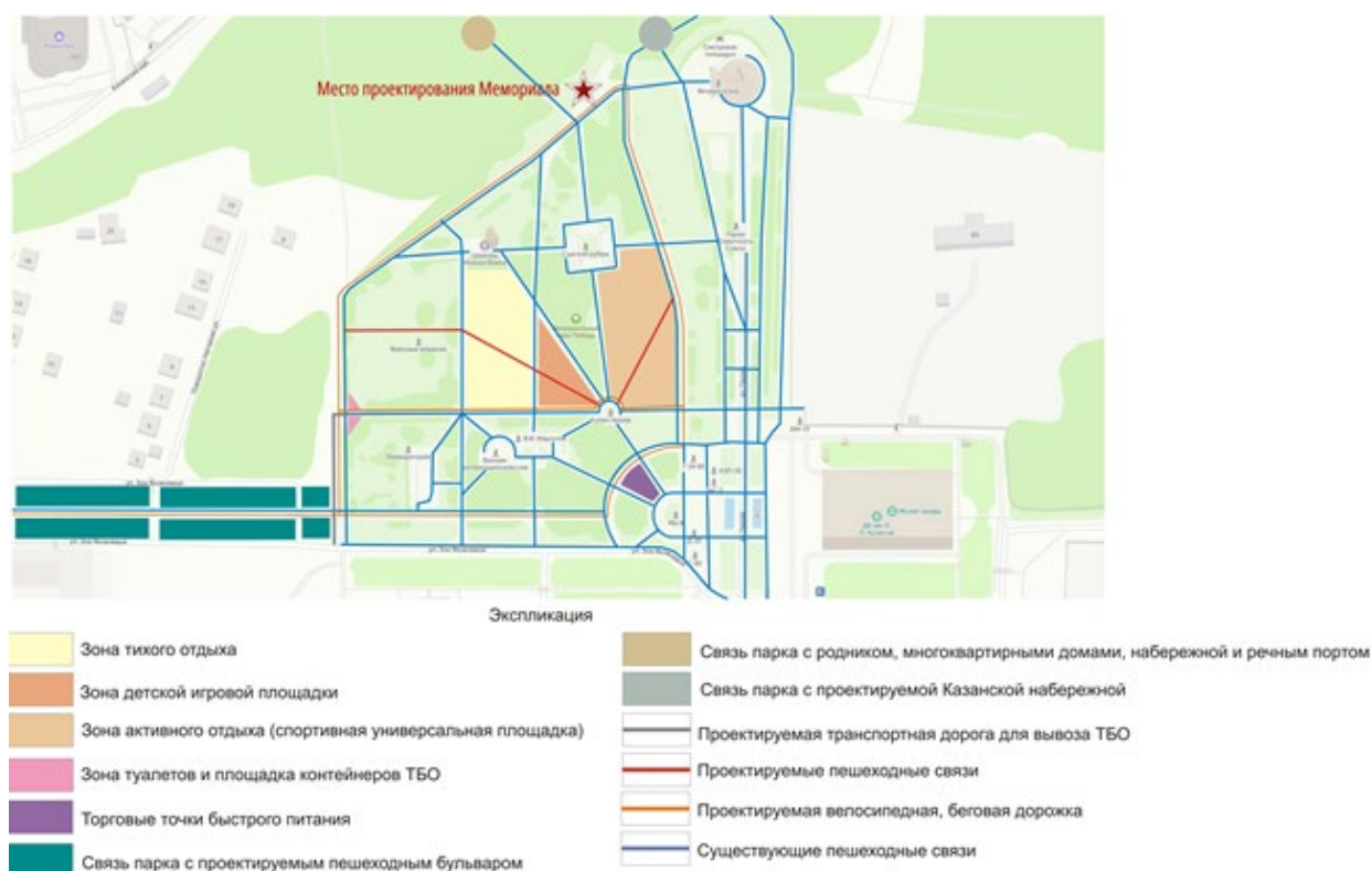
Рис.4. Архитектурно-планировочная организация территории парка «Победа» (Авторы: Галимова Л.Р., Гарифуллина А.А.)

Градостроительный анализ территории показал, что с северной стороны парка расположен крутой склон с зелеными насаждениями, выходящий на берег Волги с набережной. С восточной стороны парка – закрытая территория с коммунально-складской зоной, которая в будущем будет застроена многоквартирным жилым домом. С южной стороны – многоквартирная жилая застройка, с западной – зеленый массив с частной жилой застройкой. Проект концепции состоит из архитектурно-планировочной организации территории – генерального плана. На генеральном плане указываются функциональные зоны, транспортные и пешеходные связи, элементы благоустройства территории с основными размерами (включая освещение, используемые материалы и покрытия, озеленение и малые архитектурные формы). Предполагается аксонометрическая схема Мемориала с благоустройством его окружения, включающая все элементы мемориального комплекса с размерами в осях и габаритах (рис. 4).